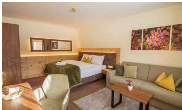
1 Seepanorama-Familien-Suite 75 m 2

Finden Sie Ihr persönliches Wohlfühlzimmer im Romantik Seehotel Jägerwirt. Alle unsere Räumlichkeiten verfügen über eine hochwertige 4-Sterne-Superior-Ausstattung in unterschiedlichen Stilen und bieten genug Platz – alleine, zu zweit oder mit der ganzen Familie.