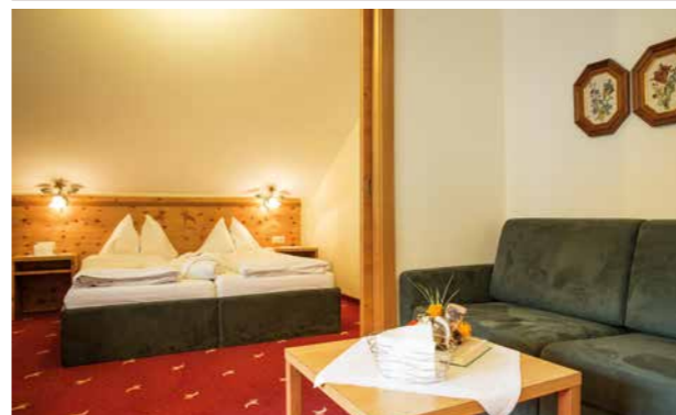
6 Zirben-Suite 44 m 2