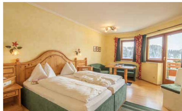
5 Jagd-Suite 45 m 2