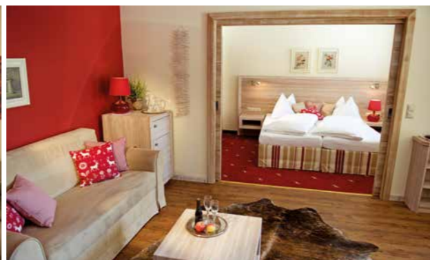
2 Edelstein-Suite 60 m 2