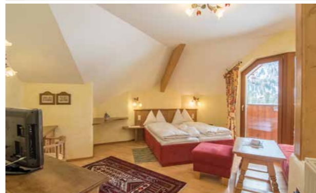
8 Romantik-Junior-Suite 33 m 2