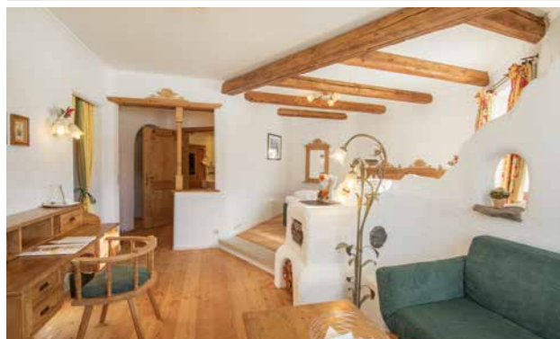
3 Romantik-Suite 50 m 2