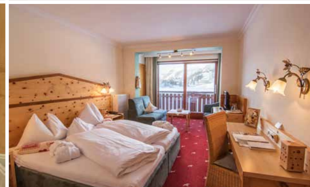
9 Zirben-Doppelzimmer 30 m 2