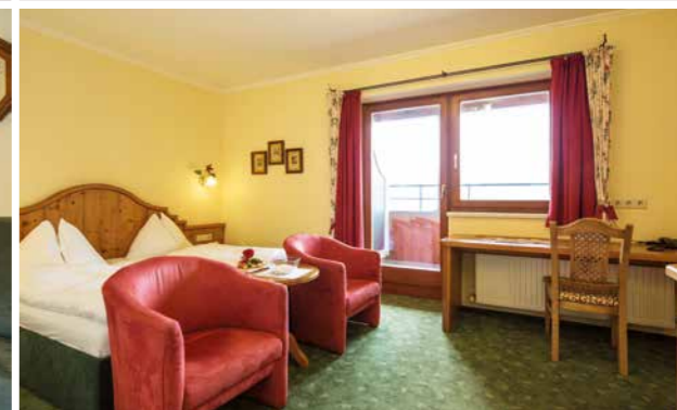
7 Junior-Suite 32 m 2